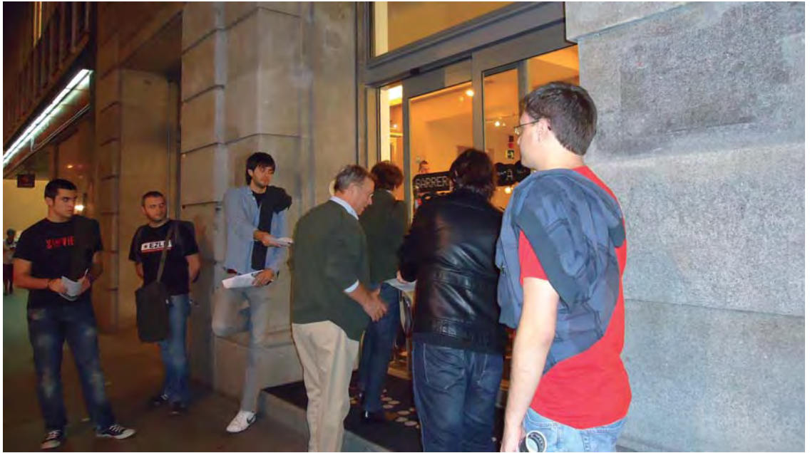
Varias personas convocadas por EUSKADI—CUBA repartieron, en la calle, información sobre Yoani Sánchez.

El periodista de Cubainformación TV preguntó si aquel era “un festival contra la censura o a favor de la censura”, y señaló que aquella actitud hostil es aplicada solo “a los medios que os interesa”, en referencia a las facilidades que ofrece el