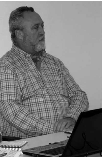
cional de Agricultores Pequeños de Cuba) y del INE (Euskal Herriko Nekazarien Elkarte).