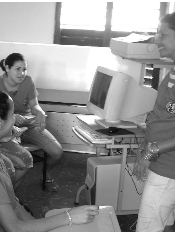
Talleres de capacitación para colaboradoras de la FMC

na básica para la inserción laboral de mujeres y hombres en el área de Gastronomía. Este último fue llevado a cabo por la Asociación Gastronómica de Cuba y el Centro Juvenil de La Corea, en coordinación con la delegada de circunscripción (representante electa del vecindario).