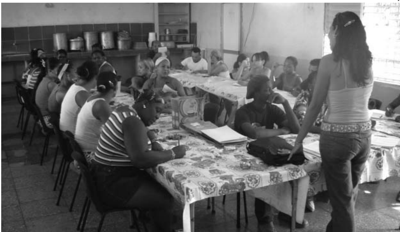
Curso de cocina básica para la inserción laboral en el barrio La Corea.