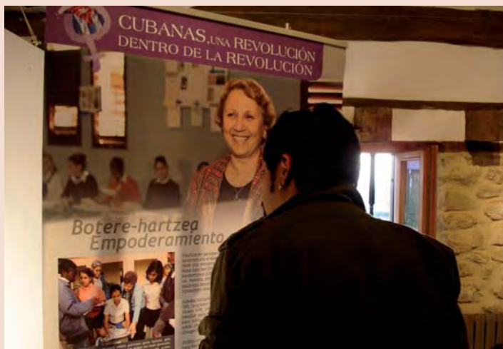
Erakusketa Murgia herrian.

Martxoan, “Emakume kubatarrak, Iraultza bat beste baten barruan” erakusketa Arabian egon zen. EUSKADI-CUBAK Gasteiz, Audio eta Murgijara eraman zuten Arabako Foru Aldundiak ere lagundu zuten erakusketa hau.