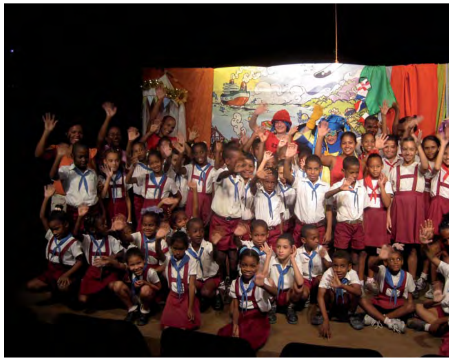
ARGAZKIA: “ANE MONNA, OSKOLA ETA KARRAMARROI”