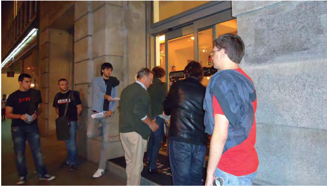
Varias personas convocadas por EUSKADI—CUBA repartieron, en la calle, información sobre Yoani Sánchez.

El periodista de Cubainformación TV preguntó si aquel era “un festival contra la censura o a favor de la censura”, y señaló que aquella actitud hostil es aplicada solo “a los medios que os interesa”, en referencia a las facilidades que ofrece el